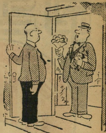
"אני יודע שאני זקן מדי בשביל בתך. באתי לאשתך!"

ביים מוצלח שוטר תנועה עמד להגאתו בכביש הסרגל, לפני עפולה. פת-אום ראה מונית עוברת אותו וחזרת בריכרס. הנהג הסביר לו שהוא מוביל קבוצת תיירים אמריקאיים, והם ביקשו לצלם שוטר-תנועה יהודי רושם דו"ח לנהג מונית יהודי. השוטר נענה ברצון, התיירים יצאו החוצה עם מצלמותיהם, והנהג הושיט את נירותיו. כשגמרה ההצגה, כולם היו מבסוטים — מלבד הנהג. הסתבר כי הושיט לשוטר רשיון-נהיגה אשר פג תוקפו, והראפורט שהוא קיבל היה אמיתי לגמרי.