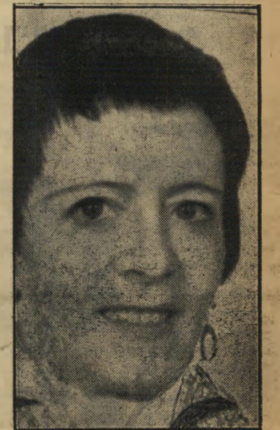
מתאבדת שולץ הבוס הוא מאחב, רמאי, בורח

הרומן נגמם גם בארץ, הגיע לשיאו ב" כמה ימי אושר שהוזג בילה ביחד בבית"