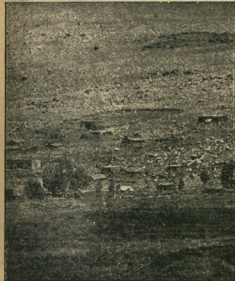
גילבינה הוא הכפר הסורי היחיד הנמצא במדרון הקדמי של שרשרת ההרים בכיוון ישראל. בכפר עצמו אין חיילים, אך הוא מוקף מכל עבריו מוצבים כיתתיים ומחלקתיים. מימין, למעלה, נראה בברור מוצב מחלקתי מחופר ומוקף תעלות קשר.

הבונקר הנראה מצד שמאל, פונה בזווית חדה ימינה ומשפס הלא בהרים. משני עבריו, לכל אורכו, מוקף כביש זה בונקרים, עמדות יריה וסדות מוקשים, אשר חלק מהם אינו מגודר, כפי שדורש זאת החוק הבינלאומי. הבונקר משמאל אופייני לביצורים הסוריים בשטח זה. הוא