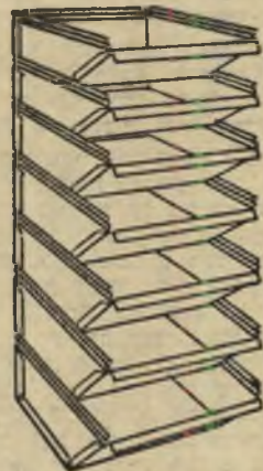
נודעת לביטחון אשך

יעיל: אחסנה יעילה החוסכת זמן, מקום ועבודה.