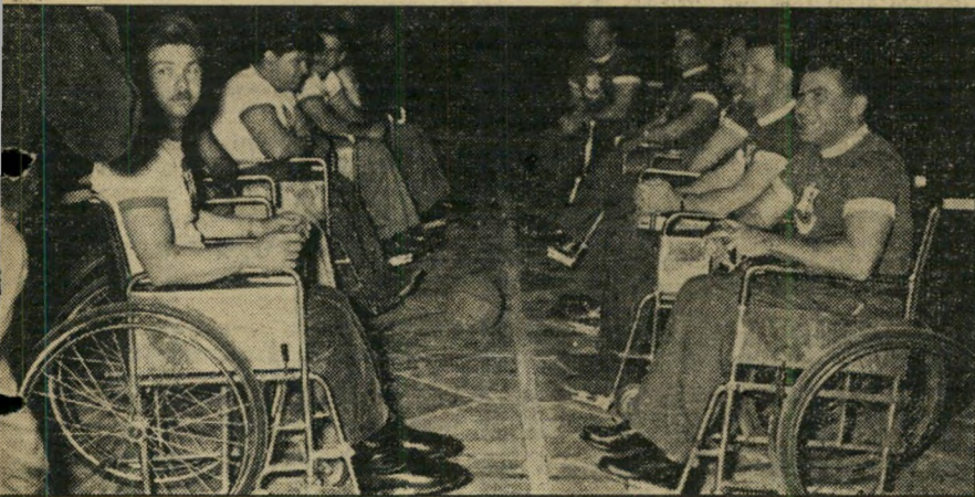
שתי הקבוצות ערוכות ומוכנות לתחילת התחרות. 12 השחקנים חולקו לשתי קבוצות, לפי חלוקה של איזורי המגורים. קבוצת רמת-השרון (ימין) פיגרה במהלך המישחק, זכתה בדקות האחרונות בנצחון (16:17) ובגביע סרי-הבסחון.