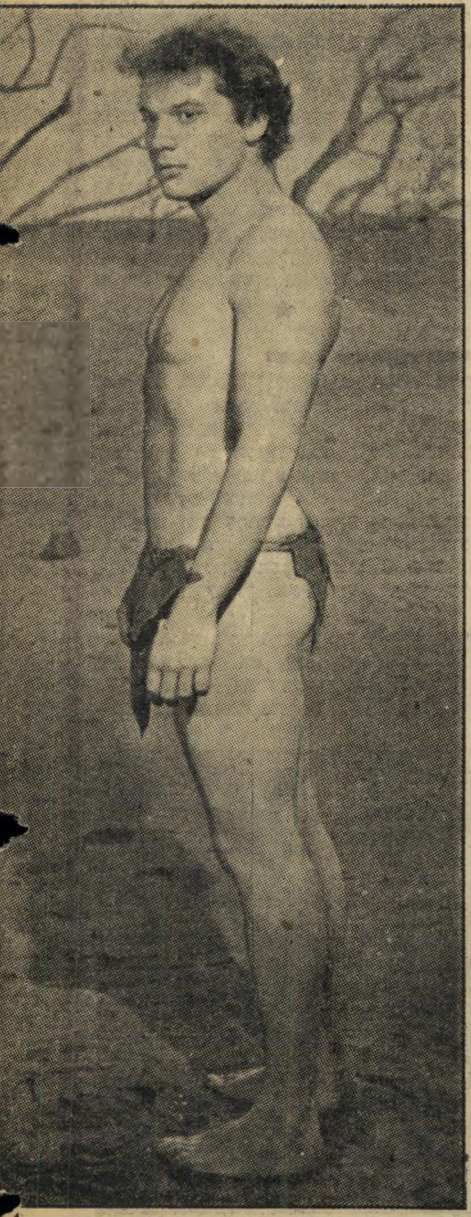
אדם האפיפור. אמר כן