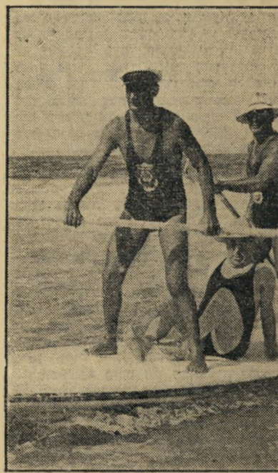
נציג אהרונצ'יק וראשי-עיר רוקה* עוזת מחוץ למים

חידוש זרם הנפט בציור מעידאק לחיפה נלקח בחשבון כמוצא אחרון, אם תנתק רע"א את זרם הנפט העיראקי לחופי סוריה והלבנון — על כך הודיע העולם חזה (1066) לפני שלושה שבועות. השבוע הודיעה דמשק על קיום תוכנית כזאת לחידוש הי