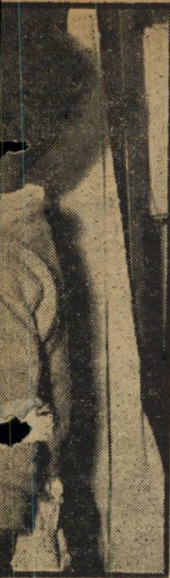
נשיקת גילים שונים.