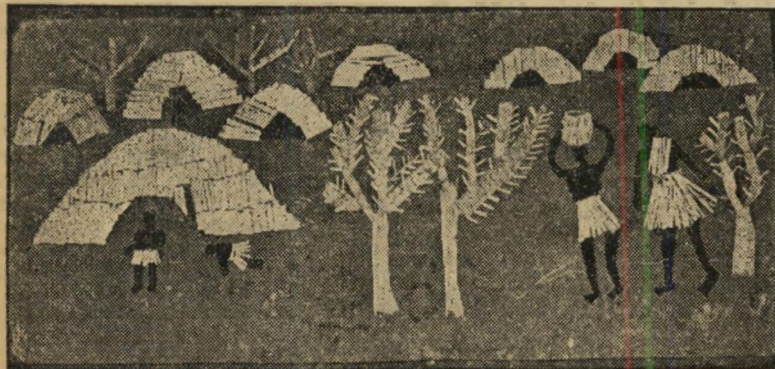
"כפר נושי" - עבודת בני 11, בית-אלמא