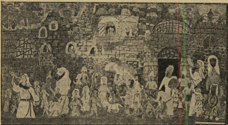
"חומות יריחו" - עבודת בני 12-13, כפרסאלד