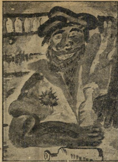
"חשיבור" - איתן (12), משמרה-העמק במכחול ובעפרון פחם, בצבעי פסטל, חיתוך בעץ וציור בגבסולי קש - הבטחה

גפד הירחון המצויר לבידור והומור * הופיע מס' 3 - גליון פורים 64 עמודים • 500 מרטה