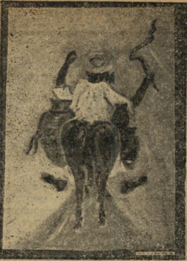
"עלי-באבא" - אילן (14), גלאון