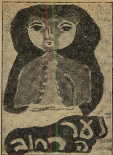
חוה (9), שריר