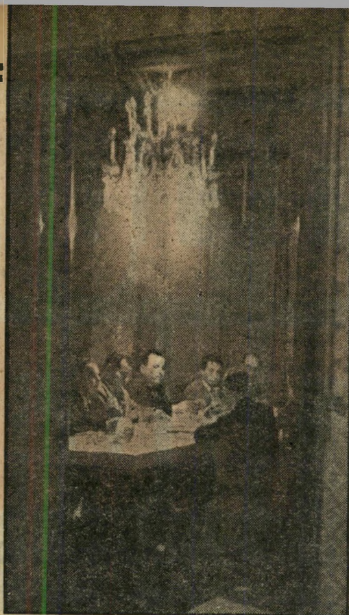
של צבא השיחרור האלג'ירי בישיבה, בבית שהונמד ל' רשותו עליידי חביב בורגיבה, ברחוב אל-סאדיקה בטוניס.

ב תפתחות רומח מאד עברה טוניסיה. כמו התנועה הלאומית במרוקו, ניהלה התנועה הלאומית של טוניסיה מרד מוזיין נרחב נגד השלטון הצרפתי. כמו הסולטן מוחמד, הוגלה מארצו גם חביב בורגיבה, ראש תנועת ניאודסטור. שנים רבות מגלותו בילה במצרים. אך עורך הדין הדינמי, חניך סורבון ושנוי לאשה צרפתית, נסה יותר לסוג הלאומנות המוכן לשתף פעולה עם המערב, בזירה הבינלאומית. מלחמתנו איננה נגד צרפת, הכריז, בעיצומו של המאבק. אנו נלחמים בקולוניאליזם הצרפתי. כאשר, לפני פחות משנתיים, זכתה טוניסיה לעצמאותה וחביב בורגיבה מונה כראש ממשלתה, הוא חתם על הוזה ידידות עם צרפת, הרשה לצבאה להישאר בטוניסיה והשאיר בידיה את הבסיס הימי הגדול בביורסה. באותה תקופה שררה ההרגשה האופטימית כי סוף-סוף נמצא פתרון לסיכסוך הממושך בין ערביי המגרב לבין הצרפתים: מרוקו כבר זכתה לעצמאותה, ואחריה טוניסיה, ונראה היה כי אף הארץ השלישית — אלג'יריה — תוכה בקרוב לעצמאות. על כן לא נראתה כל סיבה מדוע לא תיעלם איבתה של התנועה הלאומית הערבית במגרב לצרפת, ולא יבוא במקומה שיתוף-פעולה וידידות אל המערב. אך הצרפתים לא חלמו לעזוב את אלג'יריה. ארץ זו, הנמצאת בין מרוקו וטוניסיה, והגדולה בהרבה משתי