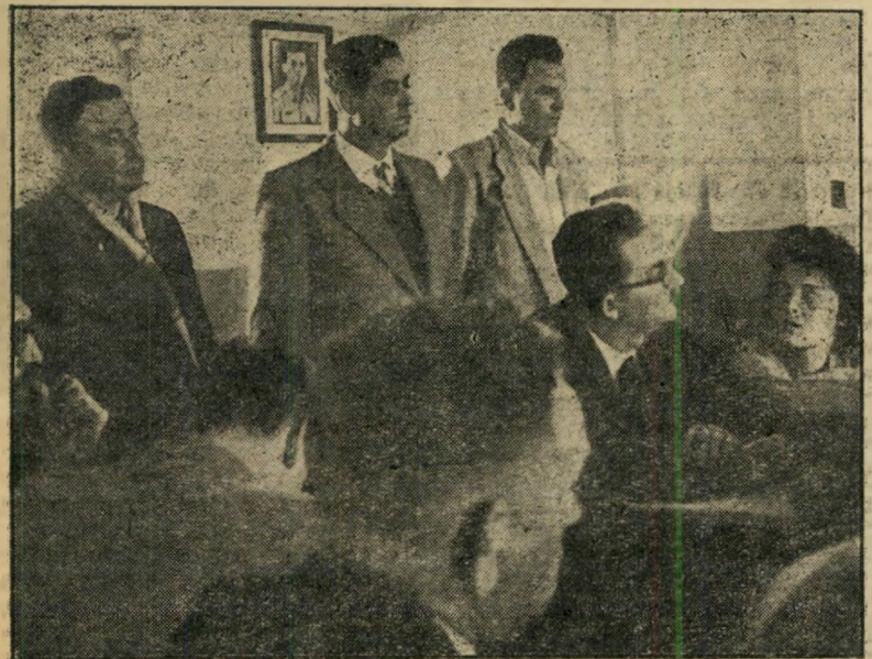
הנאשמים שלושת חשודים, לבושים אזרחית, מקשיבים לחקראת פרסי ה"האשמה. ז'ילברס בוהרון, באמצע, בשל עבר לדוגמה במשטרה, טען כי פותח בגלל מצוקתו הסמפחיתת על-ידי שוטר רביעי, שהפך עד הסדינה במשפט זה.