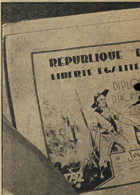
המשמשת הוכחה בידי יואנוביצ'י כי היה איש 1940. בתעודה מצויירים איש המהפכה הצרפתית ת: הרפובליקה הצרפתית — חירות, שוויון, אחווה.