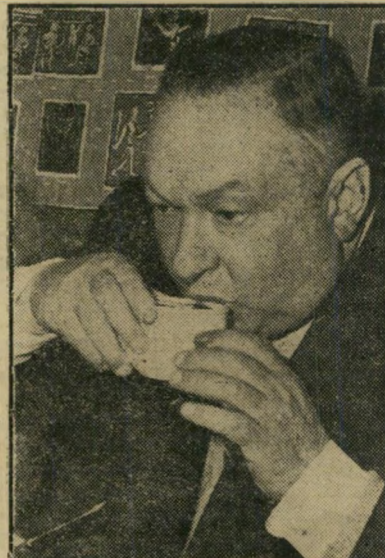
ומקטרגיו של יואנוביצ'י.