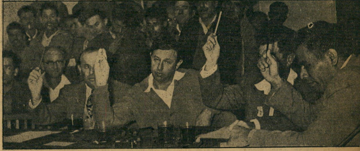
מכונת ההצבעה פה אחד אושרו, תוך שבש' דקות, ההצעות שעמדו לסדר היום. לאף אחד משומנה חברי המועצה (יושבים ליד השולחן)

דרישותיהם של אנשי חירות, לכניסתם לקואליציה, היו בתחילה, הפגנתיות בלבד: הם דרשו את כסא ראש העיר. אולם במו"מ המעשי היו מעשיים יותר. הם הסכימו ל' (חמשך בעמוד הבא)