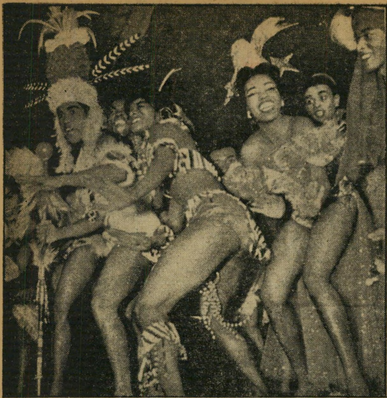
להקת בראזיליאנה בפעודה מקוריות בושית מתוצרת יהודית