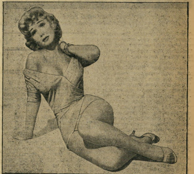
כוכבת גריי, אשת האופנה" האשה החדשה בבית האהובה לשעבר

יתכן ואין זה סרט חינוכי לנערים, אולם יש בו לקח רב להורים. לקח רב יותר יש בסרט, המצטיין ביום ובמשחק צח-