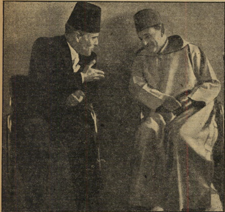
מלך מוחמד ונשיא בורגיבה ושניים ישבו במכונית בחוג

אחרי שוועדת חקירה ממשלתית גילתה כי מינהג עישון החשיש משתרש בנוער המצרי, בעיקר בשנות לימודיו בבית הספר התיכון, הועלתה הצעה יעילה: הו'