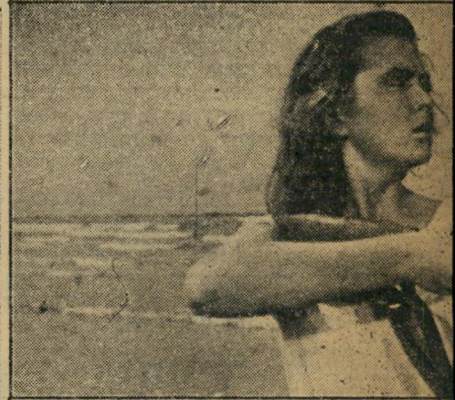
ק. לשמחתו של הקצין, אלה הם חבריו הלבנים. הוא אותו רגע שבה מאריוטקה להיות לוחמת מצבא בונת אליו מאריוטקה את רובה ולוחצת על ההדק