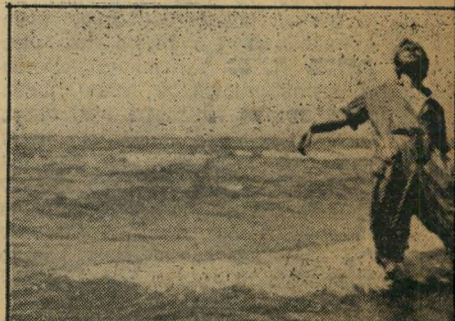
תו: הקצין נופל אל תוך הים, מת. עוד בהזמנות דו את נשקה, אולם החטיאה כאשר הרגה מאריוטקה לזחת, לקחה אותו כשבוי כדי להובילו למפקדתה.

אהבה, אחרי הכל הסרט הצבעוני, ש־ הינו מהדורה מחודשת של אותו סרט שחורסם בבריית'המועצות בשנת 1927, מסתיים