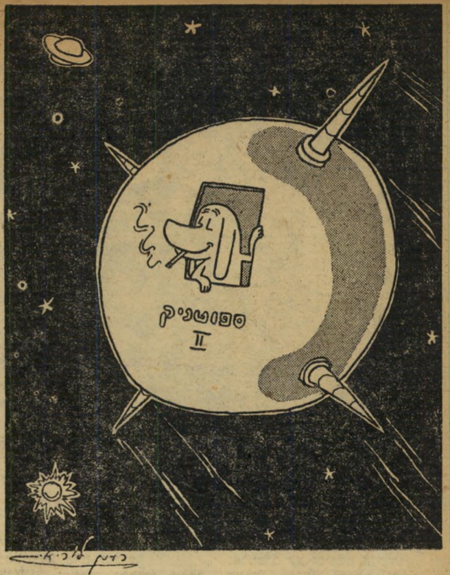
אל תתיאש — עשן „כנסת 6“

● שער הגיהנום (מוג'רבי, תל-אביב) — אגדה היסטורית, בתצלומי קולנוע איטיים נוטה תיאטרון הטבוקי. מיציקו קיו מצליחה לעשות בפניה את מה שסוסיה לורן וגינה לולובריגיידה משתלות לעשות באברים עגוי- לים נמוכים יותר.