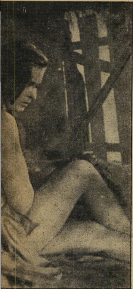
רגע אנושי מאריטקה, הלוחם על אי שומם, עם בחיך חטבני, היא שוכחת לרגע כי הינה לוחמת