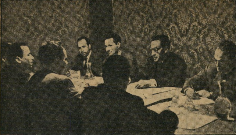
מיפקדת המרד האלג'ירי בישיבה בטונים כל עוד יהיה מי שצריך —

לפני שבועות מספר, כאשר בית-הדין של ההתאחדות לכדורגל סקס לשותף את בית-הדין ירושלים במבחן לעליה לליגה הלאומית, אחתה צהלה גדולה את אוהדי בית-הדין. משהו אף חיבר שיר רחמיאלי בנוסח המנון נוצר מסחה על הארון צירמקן. רק אחרי שהפועל ירושלים עלתה לליגה הלאומית ואחרי שקודם לכך הוצאה בית-הדין ממשחקי המבחן, החלו אוהדי הפועל לשיר בלעג את המנון בית-הדין ירושלים: