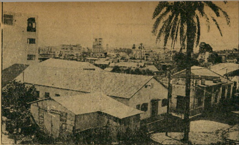
מרכז הש.א. זהו מרכז מנגוניה הש.א. בתל-אביב. הבית המאורך, השוכן במרכז וולובסקי בין עשרות בתי-מלאכה קטנים, מוסתר מעיני עוברים וסבים סקרניים. השלט עליו אומר: "האוצר — גניזה ומחקר כלכלי".

עד היום נשאר כהן עובד משרד הבטחון, ועד היום קיים קשר רשמי הדוק בין הש.א. לבין שאר מנגוניה החושך, הנמצאים כולם תחת פיקוח אחד ומרוכז. עובדה זו מסבירה גם את הסתירה בין דבריו של שרף על תקציבו של הש.א., המופיע בתקציב הממשלה (העולם הזה 1049), לבין הוצאותיו הממשיות של גוף זה, הניזון גם כיום, ללא ספק, מתקציבים סודיים שאינם כלולים בתקציב נציבות מסי'הכנסה, ושאינם עליהם ביקורת ממשית.