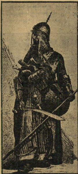
זוהם ממלוכי, עבד צפון אפריקאי בשירות הכאלוף.

8. בימי המלך אחאב, שהיה השותף השני בפדרציה של כל ממלכות סוריה וארץ-ישראל, בהנהגת מלך ארם, נגד התקופנות הסורית.