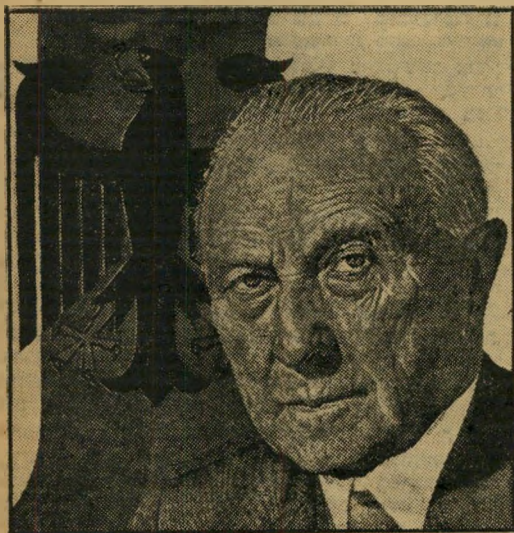
קאנצ'לר ארנואר גרמנית למעלה

התגבר תהליך חיסול הסטאליניזם. גל זה יעלה יותר ויותר את המדל של ז'וקוב, שיתגבר כצד החזק יותר בשותפות שלו עם חרושצ'וב.