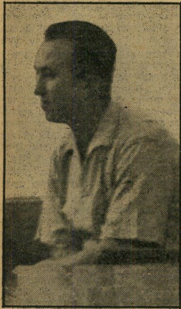
"לוקש" בבית-המשפט השרשרת אל הבדואים, סוד

מאז תפס מרכזי בנטוב, איש משמר העמק, את מושבו ליד שולחן שר הפיתוח, ניסה והצליח לסלק חברי מפא"י רבים מ-