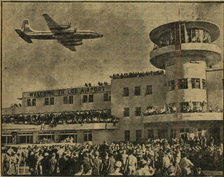
ה"בריטניה" מגיע ללוד 3000 איש, לחישה מהירה

● החנות האלגנטית לתמרוקים סמדר ברחוב פרישמן 77, מול ככר מסריק, שולחת מיטב איחוליה לשנה החדשה, לכל הלקוחות. בחנות סמדר תמצאו את המתנות הנאות ביותר. כל בחור או בחורה, כל גבר ואשה ימצאו לבן או לבת זוגם את השי העדין והנאות ביותר: מיטב התמרוקים הפאריסאיים, תכשיטים וכן דברי קישוט יפים.