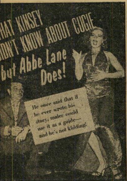
מה שקינסי לא ידע על קוגי (קסביאר קואסט), אחת הכתורות הי משמיות חאופייניות לעתוני הרפיש.