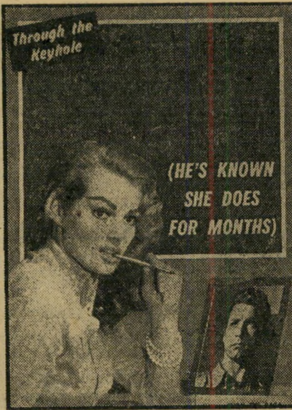
דרך חור המנעוה, סציני קונפידנשל של על חייה הפרטיים של הקרחון הש וודי אניסה אקברג עם אנטוני טייל.