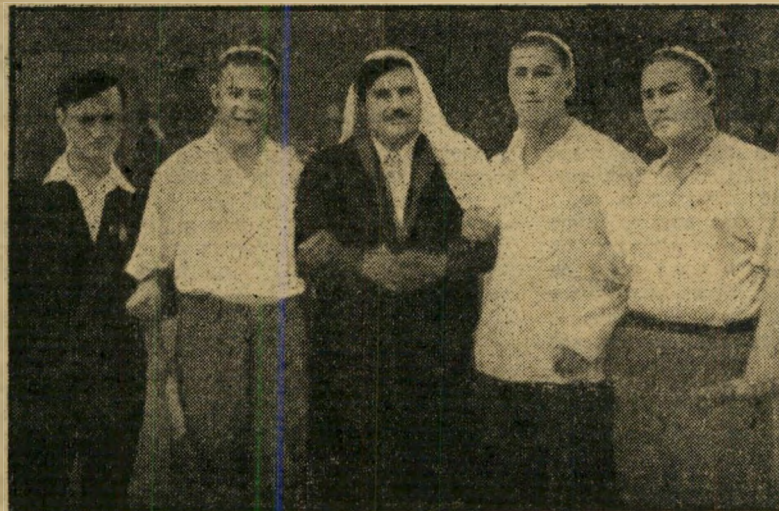
תורכמניק שלושת הנברים בחולצות חלבנות הם בני הריפובליקה התורכמנית הסובייטית, שניגשו אלי בהתרששות רבה וחודיעו שחם סוסלסים, כסוני. האיש הקיצוני משמאל הוא רוסי שהצטרף לצילום. ברקע: הסאודזליאוס.