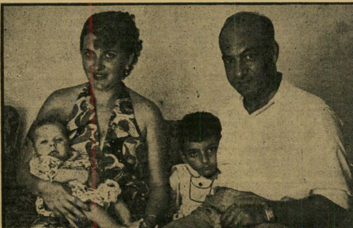
תחילת הסוף. תמונה שצולמה לפני כשלוש שנים, בה נראה הזוג עם שני הילדים. סמוך לתאריך הצילום חל המשבר בחיי הזוג, שהביא לפרוד ותחילת השערורייה.