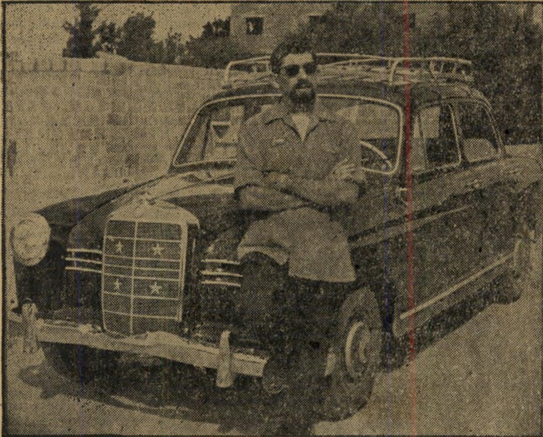
מונית ערבית בעזה. המצרים שהכירו היטב את המקום, ראו בתמונה זאת הוכחה ניצחת לכך שהייתי בין הלוחמים בעזה, בימי כיבוש העיר.

הובלתי לחדר. שמעתי מוסיקה של רדיו. כמה אנשים דיברו בערבית, ונסחבתי במשיכת-