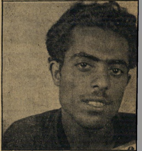
אקרחה חרד. גנטסטר במהדורה ישראלית, אחד מאיליו הנערצים ביותר של נוער שכונות תל-אביב, מארגן הבריחה האחרונה, טרם נתפס.

ישיבותיו התכופות בבית-הסוהר והיית המחתרת שלו לא מנעו ממנו לשאת אשה ולהוליד שני בנים. אולם כשישב תקופת מה בבית-הסוהר, ושמע כי אשתו בוגדת בו עם קלאג'י, מלך-האגרוף של שכונת התקווה, נתן לה גט. כשיצא מבית-הסוהר