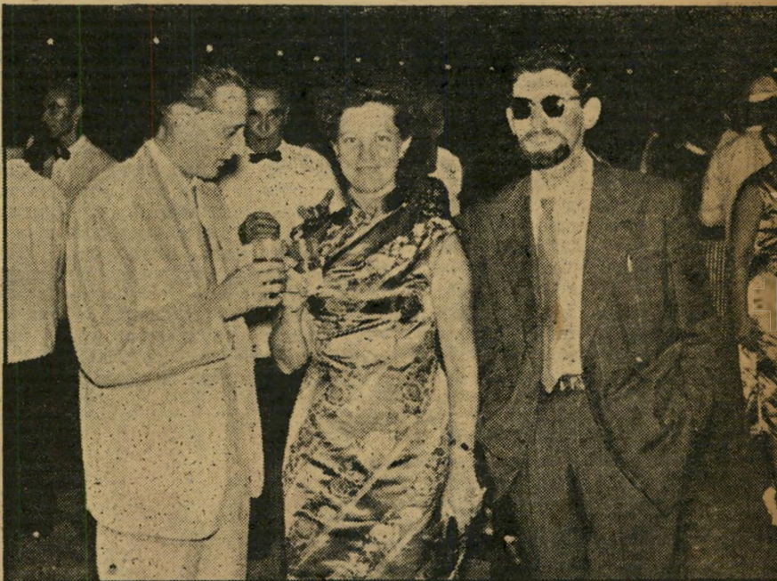
בין הדיפלומטים צולם רפי נלסון במסיבת יום-העצמאות של הצירות הישראלית בראגון, בשעה שהוא מרכיב את משקפי-השמש הנצחיים שלו. לידו: ישראלים בבורתה.

על המיבצע, והספיק כבר לקרוא אותו בינתיים.