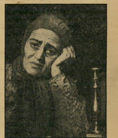
שחקנית גובינסקא מט

כשנפטרה בשבוע שעבר, ליוו מאות את ארוונה. היו ביניהם מאות שהעריצוה כשח