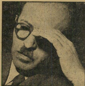
מנחם בגין: התפרצות לדירה. מאיר יערי: מכשיר בשוחן.