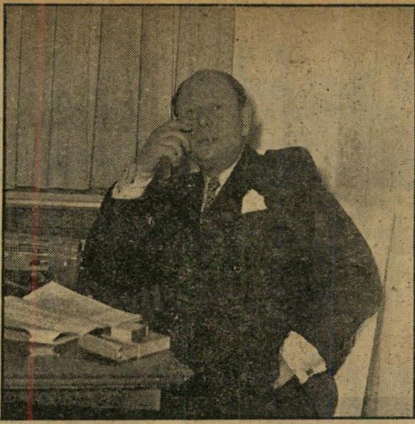
ראשי-סיעה סרלין לא כל כך

עלים את מקורות האינפורמציה שלו, בת נאי שהוא עצמו מקבל על עצמו את האחריות לתוכן הדברים. לכן לא יכלו ראשי מפא"י לכוף בטענות אל הארץ אילו מסר את תוכן המכתב לחקירה בלתי-תלויה, גילה כי הדברים נכונים ופירסם אותם על אחריות העתון.