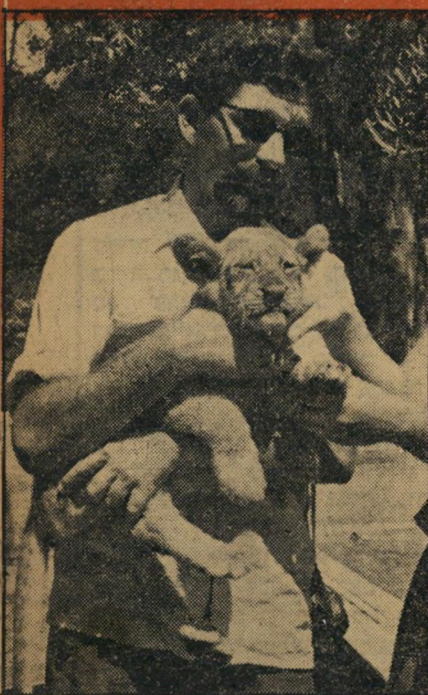
גור אריה רפי אינו כותב מה עלה בגורל הגור, אם לקח אותו לראגנון ואם ניצל מהשריפה הגדולה.