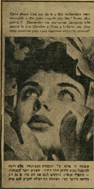
Cette photo est pas de la s. elle est destinée à être utilisée dans les journaux et les revues. Demandez nos conditions de location et les détails de la location à l'adresse ci-dessus. Une question pour tous répondre est à Colossal.