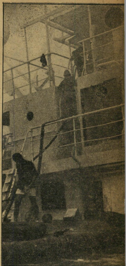
נבאי בורגאי על סירת הבירגיטה סירה זו, יחד עם עוד סירותיכבו, הני