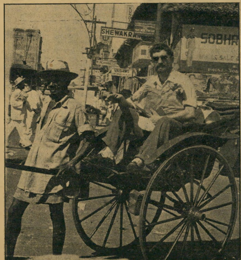
תחבורה זולה. הריקשה היא כלי התחבורה העממי הזול של קולומבו. "פעם היו הרבה מובטלים בעיר," כותב נלטון, "עכשיו הם כולם בעלי ריקשות המחפשים פרנסה."

לאגודה הבודהיסטית הזו קוראים קלנייה. יש לה סיפור משלה, כתוב כולו צ'ילוני. תמצית אומרת שבודהא ביקר כאן פעם באופן אישי ומשום כך המקום הוא קדוש מאד לכל אלה המאמינים בבודהא. חלצתי את נעלי וצילמתי בחדרת קודש מוחלטת את כל מה שהיה לצלם.