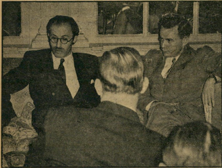
תמיר 1949 — עם בניין במסיבת-עתונאים בניירורק הפתרון — בחוץ או בבית?