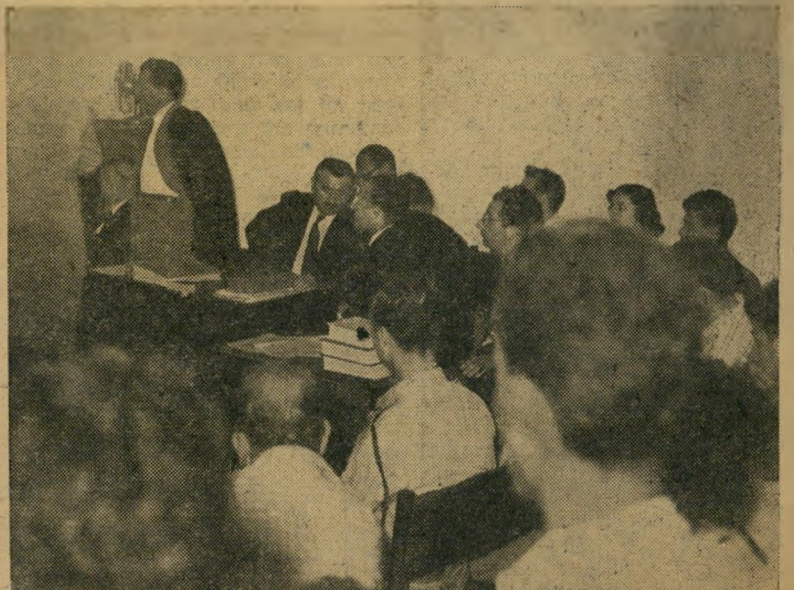
תמיר 1957 — בשעת הטיעון במשפט עמוס בן-גוריון

ידיים ורזיות אך נסתרות סיפקו לבטאנוי מפא"י תיאורים ססגוניים של קנוניה פולי-