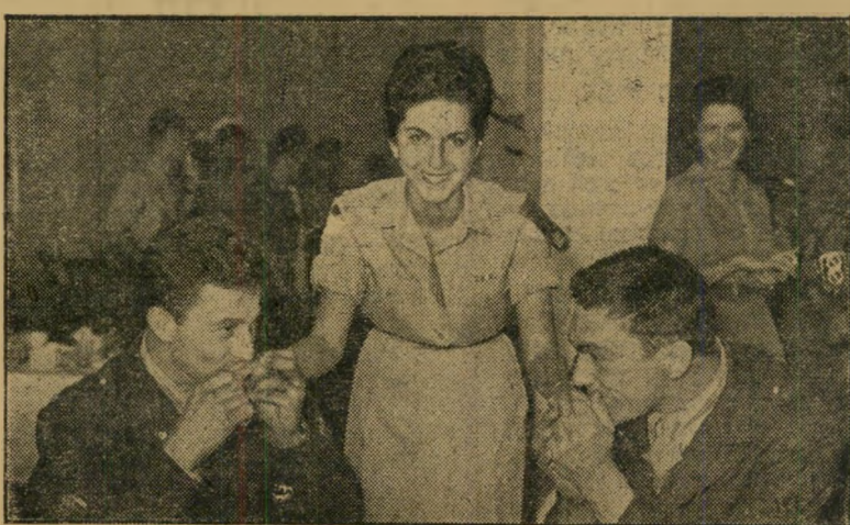
אירידידה! כבר בבואם לשדה-היתעופה בלוד נתגלו כדורגלני צרפת כתקפניים מאוד. בתמונה נראים שניים מהם, כשהם מודים בצורה צרפתית מאוד לאחת מחיילות צה"ל, ששימשה להם כמארחת. המארחות ענדו לצרפתים את תגי צה"ל, זכו למחמאות פעילות

נגד איוה שחקנים עוד לא שיחקתי בחיים שלי. שיחקתי נגד תורכים ונגד רוסים.