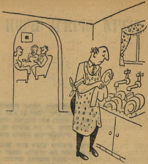
אל תתיאש — עשן, כנסת 6

הקטע הנידון, שמצא כל כך חן בעיני ה"רודן המצרי, קבע: "אצל נאצר יש הרבה שאינו רגיל במנהיגות מהאסכולה הישנה: מידה של צעירות, להט, רגש ושאיפה כנה לתיקונים. האיש כנה ברצונו להביא תי"