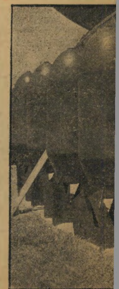
אחת הפצצות הגדולות, ימנו כמעט פי שניים.

אוי הנביחה היה עצוב יותר. שום של הטור המשוריין נפגעו ה. מפקד נתן פקודת היערכות. זאומיות בה החלה, נפסקה ק התמשך. אחריו בא ענן ה" שיה אופיני כמעט לכל המבצע: