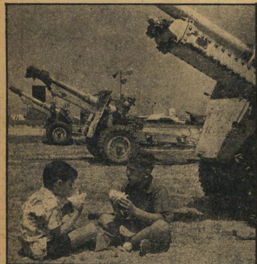
"בתיאבון!" יואל ומוטי סועדים את לבם בצל תותחי השדה הבריטיים, בני עשרים וחמש ליטראות כל אחד. תותחים אלה היו בשימוש הצבא המצרי ונלקחו כשלל בעזה.

אבל בכל זאת נראה מרוצה מהעובדה ש-120 אסור לעשן דווקא מפני שמנקים, לא מפני שירישים.