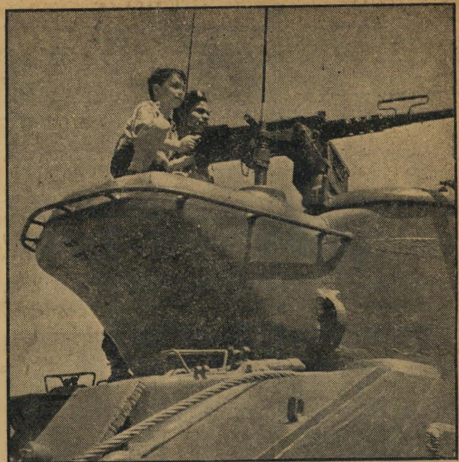
"למטרה, אש!" על צריח הטנק הצרפתי הקל מורכבת מכונת ירייה כבדה. שתי אנסנות מאבסחות קשר תקין בין כל הסנקים בשטח.

המצרים עזבו. "בירגפנפה בידונו!" הכריז העלון הקרבי שהופיע עוד באותו יום.