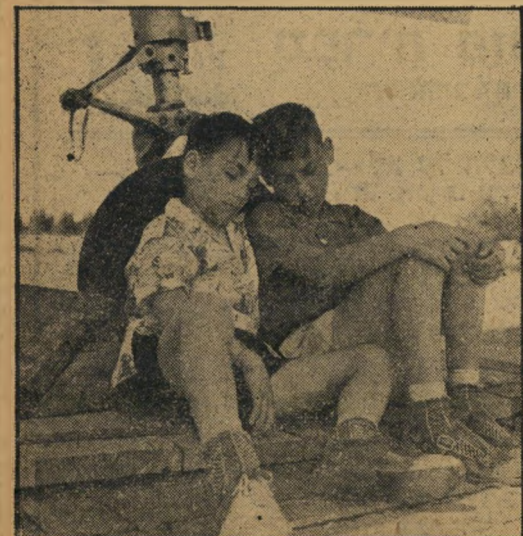
"ליל מנוחה." המבקר העיף יוכל לנוח ולנמנם בצל אחד המטוסים שנחתו על דשא תערוכת הנשק בבית-דגון.