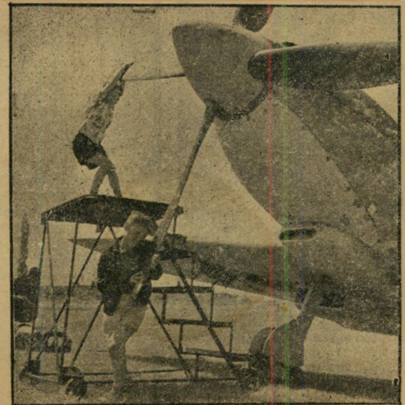
"...א...!" אחד מצירי ההתענינות הכללית יהיה בוודאי המיג-15 הסובייטי, החוצג על כל אביזריו, כפי שנפל שלל לאחר קרב אווירי ואולץ לנחות בין אל-עריש וטואק.