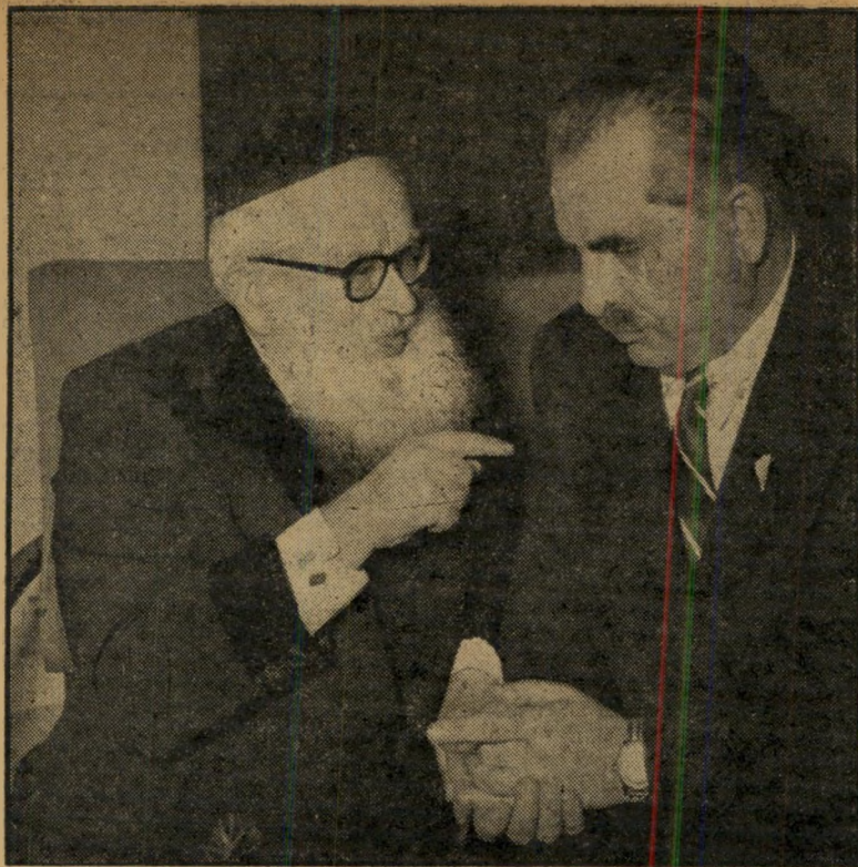
שריחמקד שפירא והרב הראשי הרצוג לשולחן הסדר, בלב שקט