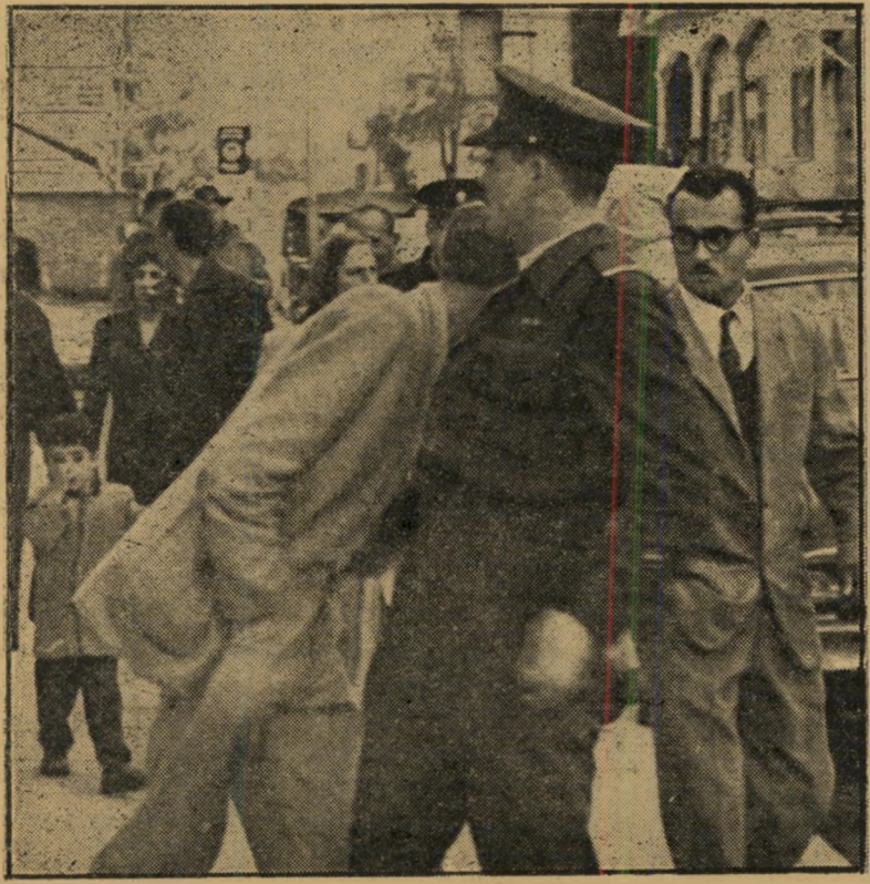
הטיפול. שוטר עוצר אדם החשוד בהחזקת סם משכר והמוכר כנו'קומן. התמונה צולמה עלידי צלם העולם הזה בשעה שעקב שעות ארוכות אחרי פעולות הנרקומן החשוד.

אלף הנורעות המדולדלות, נקובות וריקות הסמים, עשיות עוד להיות אלף זרועות של זהב.