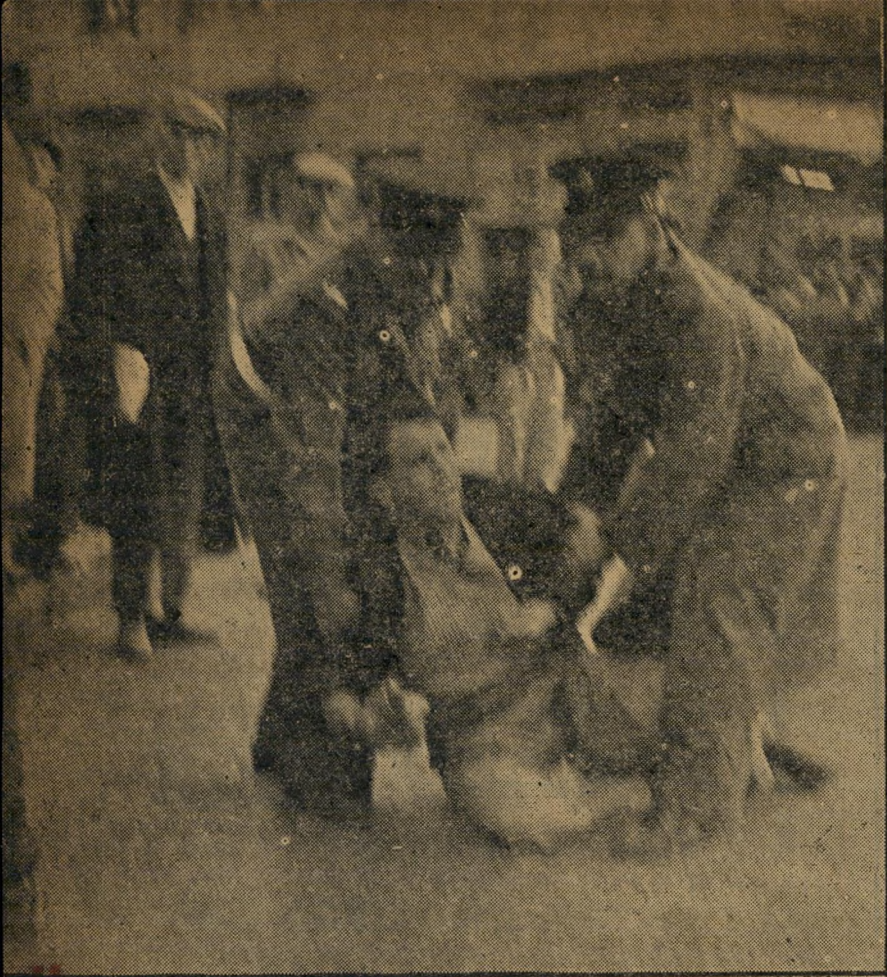
התגאול שני שוטרים ירושלמיים גוררים מרחבת הכנסת נכה מפגין. התנהגותם של השוטרים היתה גסה והם דאגו להסיר תחילה את מספריהם.