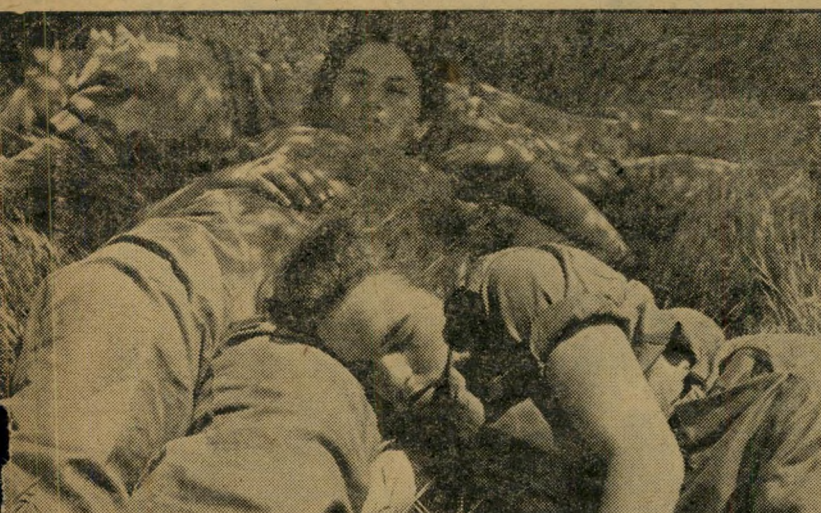
מנוחה בחורשה. בתום היום הראשון לצעדת החיילות, משתרעות הבנות בחורשות.