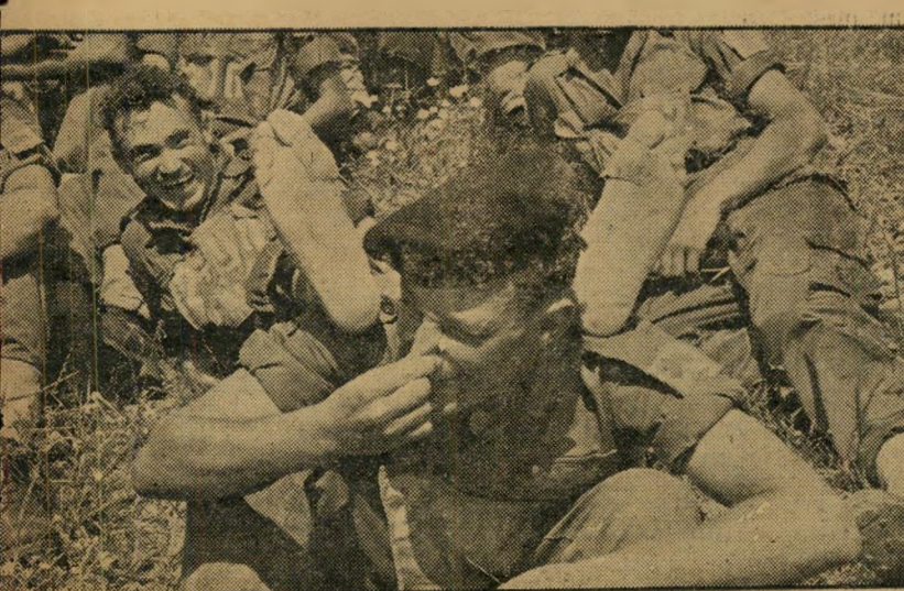
על אף הכל. ריתן של הרגליים היחפות אינו ערב ביותר אך מסוגל לעורר צחוק.

רוצה גם להתרשם מדברים כאופי מגר בש ומעמיק, ראש הפועל כהלכה, פרצוף ש, אומר משהו. אני רוצה לפנות בזה, באמצעות מדורך, אל כל בנות המין ה' יפה, בקריאת מלחמה: מי בכך, מכל אלה החושבות עצמן למשהו קצת מיוחד, תעמד במבחן ההתכתבות, ותצליח לי הרטיט את לבי כל אמת שאגש לחיבת הדואר? תנאי הלחימה הם: דוגריות, זה עוה, חוסר גיגונים והצטעצעות, ואף שליחת תמונה. הגיל: 19-23. "אדי פולו! קדימה!" קצת מאכזב הסוף, לגבי סטודנט ה' טכניון, מה?