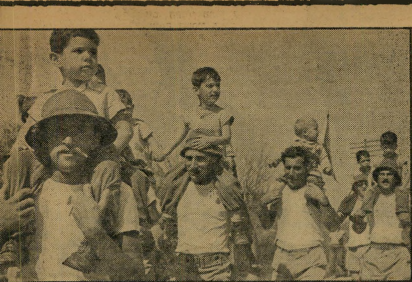
משקד נופף לקבוצת הצועדים של קיבוץ נחשון אשר בדרך לירושלים, הם בניו.