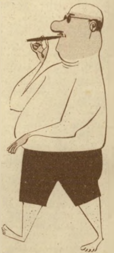
4 בצהרים הוא הולך הביתה ברגל