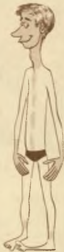
11 הבגדים צרים עליו