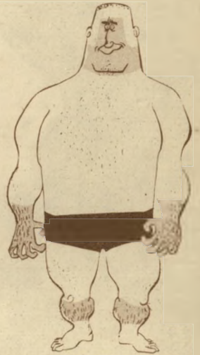
2 הוא עובד בנגב עם כובע טרופי