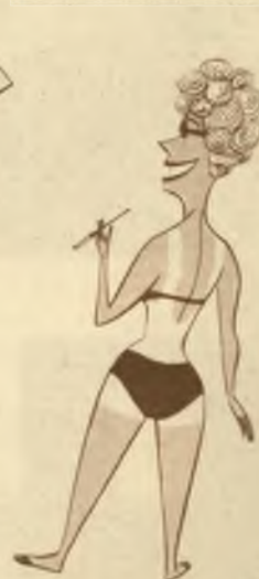
5 האופנה החדשה של בגדי-הים