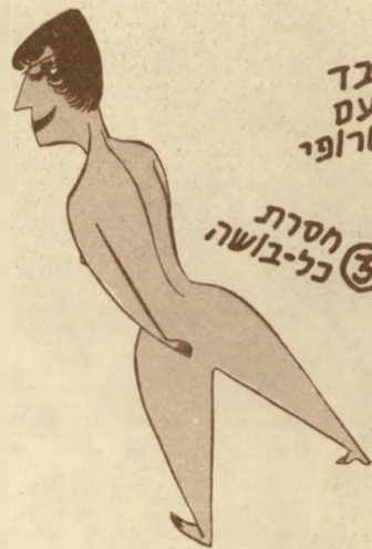
3 חסרת כל-בושה