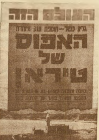
1956 הסיבוב השני