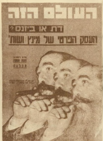
1956 מיניץ: דת או ביזנס?