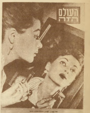
1951 איבון דהקארלו בישראל

מבחינה ציבורית ומבחינה עתונאית, העולם הזה עודנו בראשית דרכו. אני רוצה לאחל לך, לחברי במערכת ולעצמי רק איחול אחד: שלעולם לא יגיע היום בו יגיד העולם הזה: "הגעתי אל המטרה, מעתה אין עוד צורך בשינויים ובהתפתחות נוספת".