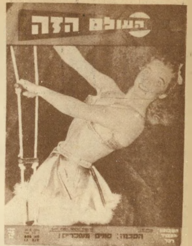
1950 לולינית הזירהמרון