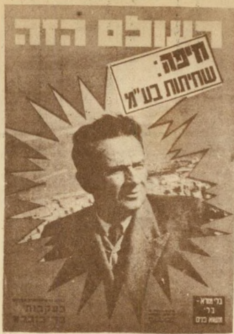
1955 הכובש של הושיעטאן