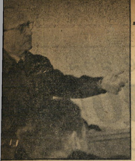
ספר 2 מצטק

הכל התחיל כשהסירמה היפנית קנאי קורסו-קי רצתה לפתח את יחסי המסחר בינה לבין ישראל. יהודי בשם טאובר החל להציף את