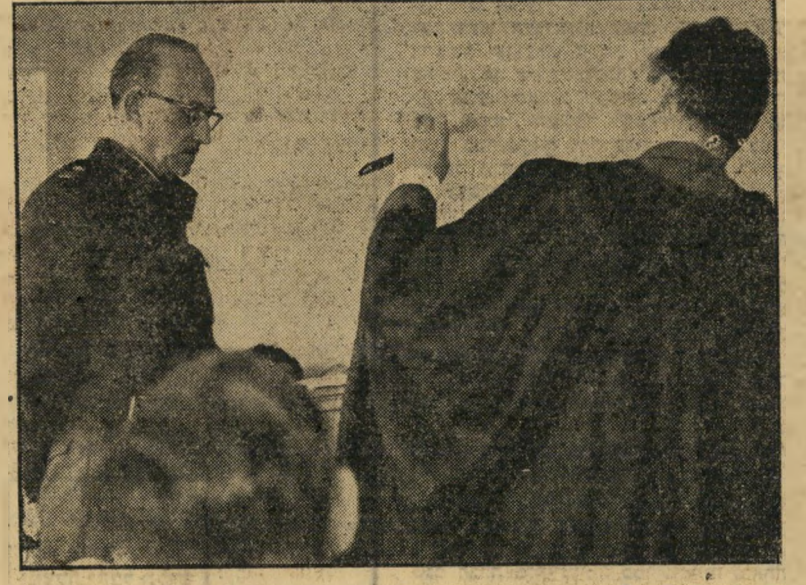
ספר 3 אינו זוכר

את הסחורה צריכים היו לקבל המלונאים. אולם התברר כי חלק גדול ממנה מורכב מכלי בית במקום כלי מלון, ולא נותר ל-מלונאים אלא להרשות לירקוני למכור את הסחורה בשוק החופשי. באותה תקופה של פיקוח על המחירים נקבע המחיר על-ידי משרד המסחר והתעשייה. כבסיס לקביעת מחיר זה נלקחו החשבונות המזויפים שכללו את האחוזים הנוספים ודמי ההובלה. כש-נפתחו השבוע תיקי אירס"ו בבית המשפט, התברר כי מחיר ההובלה היה כלול כבר במחיר הגרמני. אולם כמה מהמלונאים התלוננו על ה-